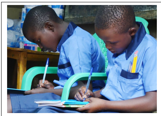
Nieuw schooljaar, nieuwe schriften!