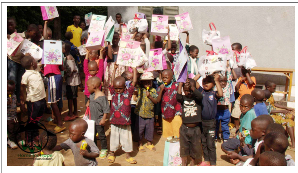
Kerstactie met cadeaus en maaltijd

In elk geval is SiH gecommitteerd aan het blijvend ondersteunen van kinderen uit de doelgroep om tot en met middelbare school onderwijs te krijgen en zo mogelijk door te stromen naar beroepsonderwijs of universiteit.